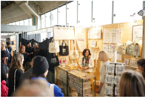
Salon des Métiers d'Art du Québec 2022