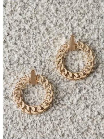
Mauvais choix de fond pour l'objet