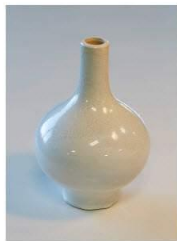
Différentes températures de couleur