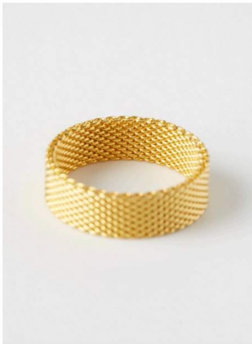
Mise au point au mauvais endroit