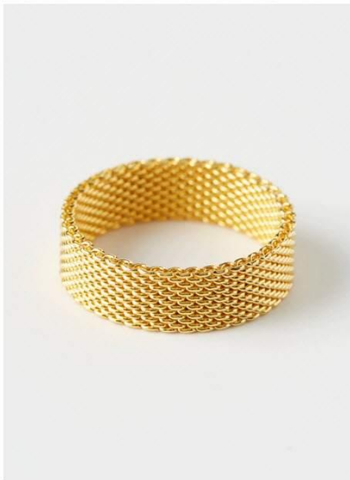
Mise au point appropriée