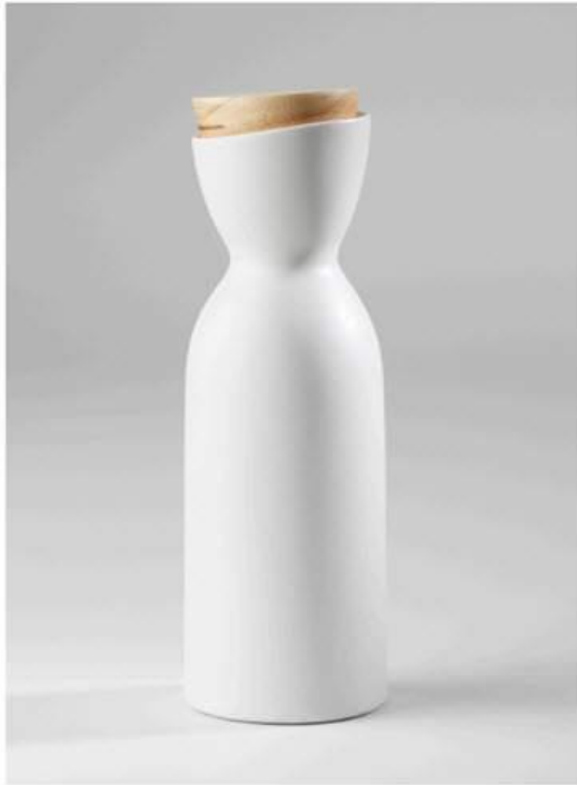
Deux sources de lumières dans des directions opposées