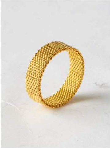
Fond sale et abîmé