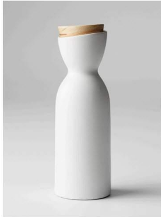
Une source de lumière principale