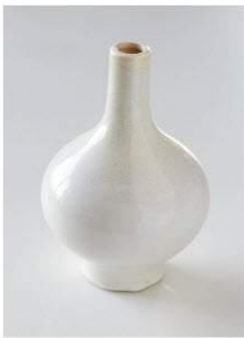
Bonne balance des blancs