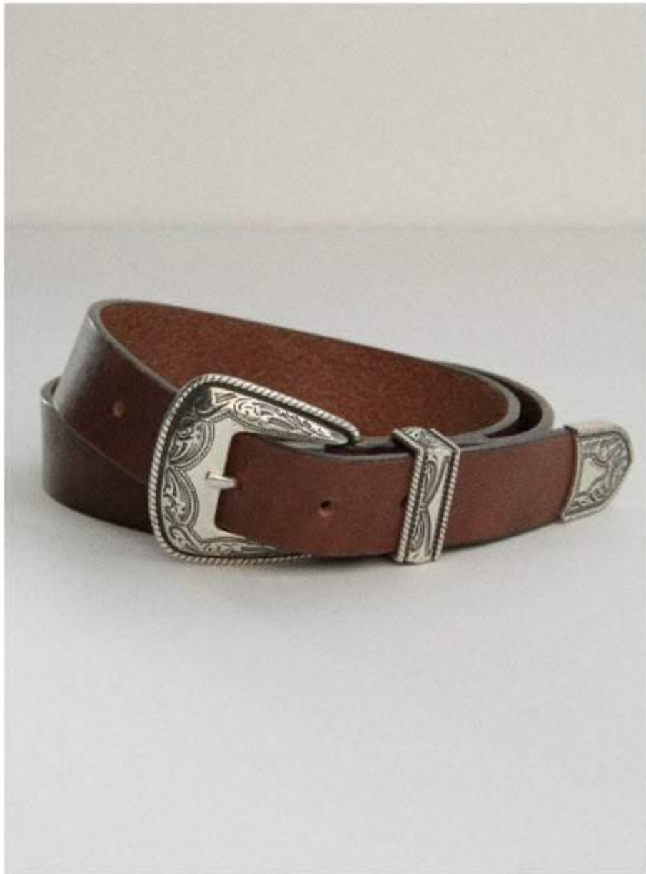
Image trop granuleuse