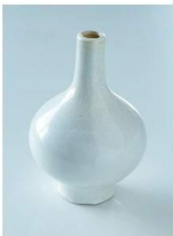
Mauvaise balance des blanc