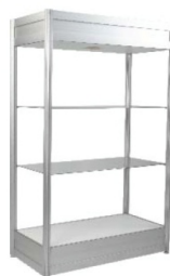
Présentoir vitrine Showcase 40" x 20" x 80"H 20" de large aussi disponible / 20" wide also available