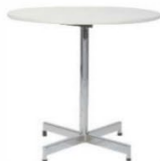
Table Table 30" x 30"H