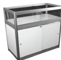
Comptoir vitrine Showcase counter 40" x 20" x 40"H