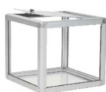
Boîte de tirage pour table Raffle cube for table 12" x 12" x 12"H