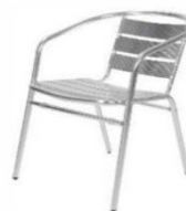
Fauteuil aluminium Aluminium armchair