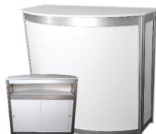
Comptoir courbé, portes coulissantes Curved counter with sliding doors 40" x 32" X 40"H