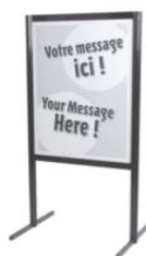
Porte affiche Sign holder 60" H