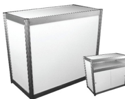
Comptoir, portes coulissantes Counter with sliding doors 40" x 20" x 40"H