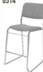
Tabouret tissu gris High stool grey fabric