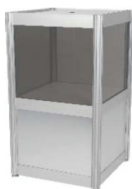
Boîte de tirage Raffle Box 18,5" x 18,5" x 40"H