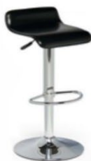
Tabouret Alice Alice Stool