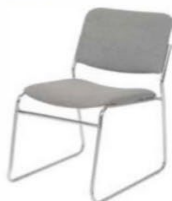
Chaise tissu gris Side chair grey fabric