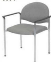
Fauteuil tissu gris Armchair grey fabric