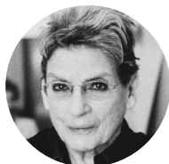
Phyllis Lambert Directeur fondateur émérite du Centre canadien d'architecture